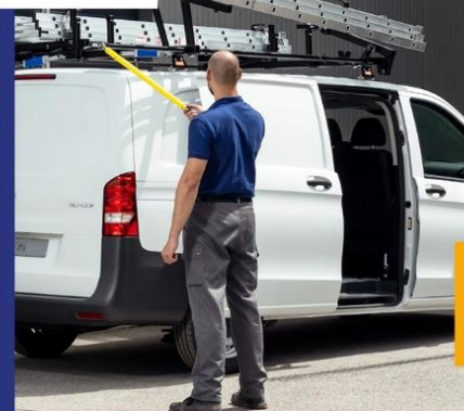
Strešné tyče a nosiče rebríkov

Tel: +421/908 590 460 / Email: vans@vans-solutions.com